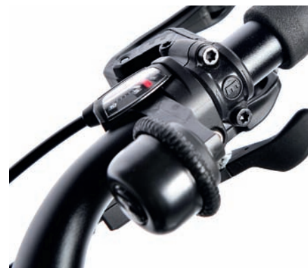
Kleine Daumenbewegung, heller Klang: Die Glocke wird zum Läuten gedreht.