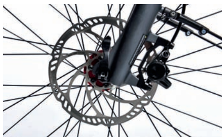
Hydraulische Scheibenbremse Magura MT2 mit zwei Kolben.

W inora-Staiger erfüllt optisch mit dem Sinus Tria 10 die Bedürfnisse des Zeitgeistes. Dunkles Grau ziert den Rahmen, die Komponenten sind alle mattschwarz. Mit der grauen Farbgebung kommen die Schweißnähte des Rahmens besonders zur Geltung. Zu unserer Freude sind diese sauber und fachgerecht aufgesetzt. Der Akku sitzt optisch gelungen semiintegriert auf dem Unterrohr des Rahmens. Für Komfort sind die Suntour-Federgabel und die Federsattelstütze zuständig. Ebenfalls zur Entspannung dienen der leicht gekröpfte Lenker mit ergonomischen Griffen. Der Bosch „Performance“ mit 60 Nm Drehmomentspitze hat auch für steile Bergpassagen ausreichend Power. Mit Magura Scheibenbremsen sollte das Sinus sicher zum Stillstand kommen.